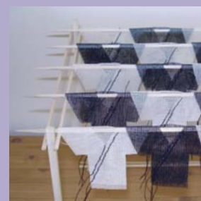
Gast: Mieke Thijssen www.miekethijssen.nl